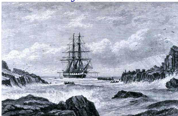
Le Challenger à St. Paul's Rocks

In: "The Voyage of the Challenger The Atlantic" Vol I, by Sir C. Wyville Thomson, 1878.