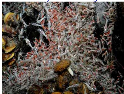
Ifremer-Victor / Campagne Serpentine 2007

La campagne Serpentine a aussi été l'occasion d'étudier les microorganismes piezophiles. Ceux-ci peuplent les grands fonds, ils sont aussi appelés barophiles (aimant la pression) et font partie des extrémophiles (qui vivent dans des conditions extrêmes) tout comme les microorganismes hyperthermophiles (croissance optimale au-delà de 80°C) qui ont déjà été localisés sur des sources hydrothermales. Les scientifiques s'interrogent sur l'évolution de leur croissance en fonction des facteurs que sont la température et la pression.