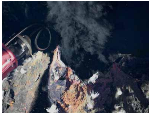
Ifremer-Victor / Campagne Serpentine 2007